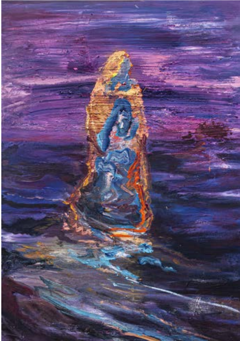
100 × 70 cm, olej na płótnie