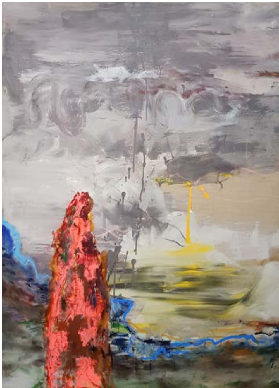
150 × 120 cm, olej na płótnie