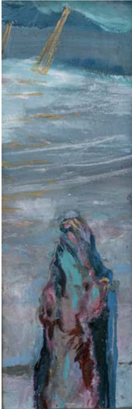
100 × 35 cm, olej na płótnie