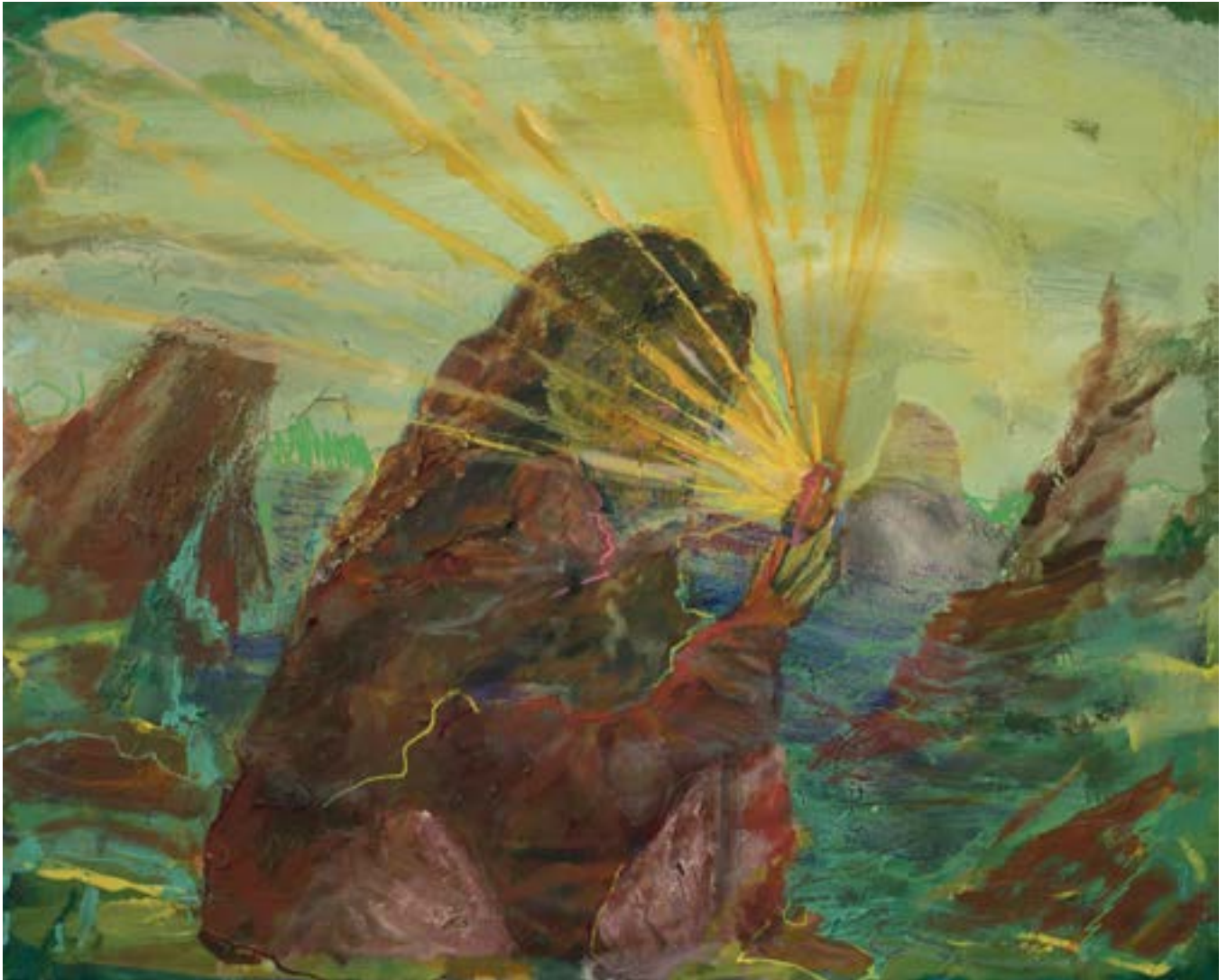
50 × 70 cm, olej na płótnie