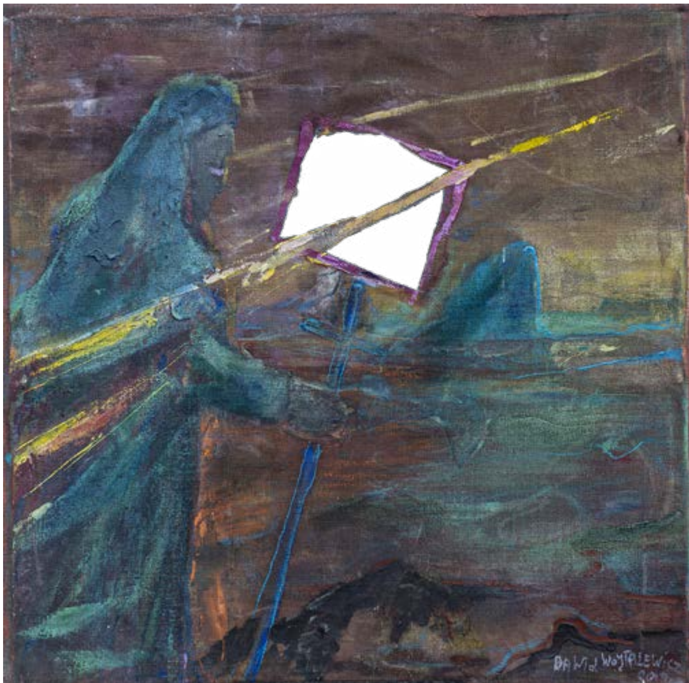
87×87 cm, olej na płótnie