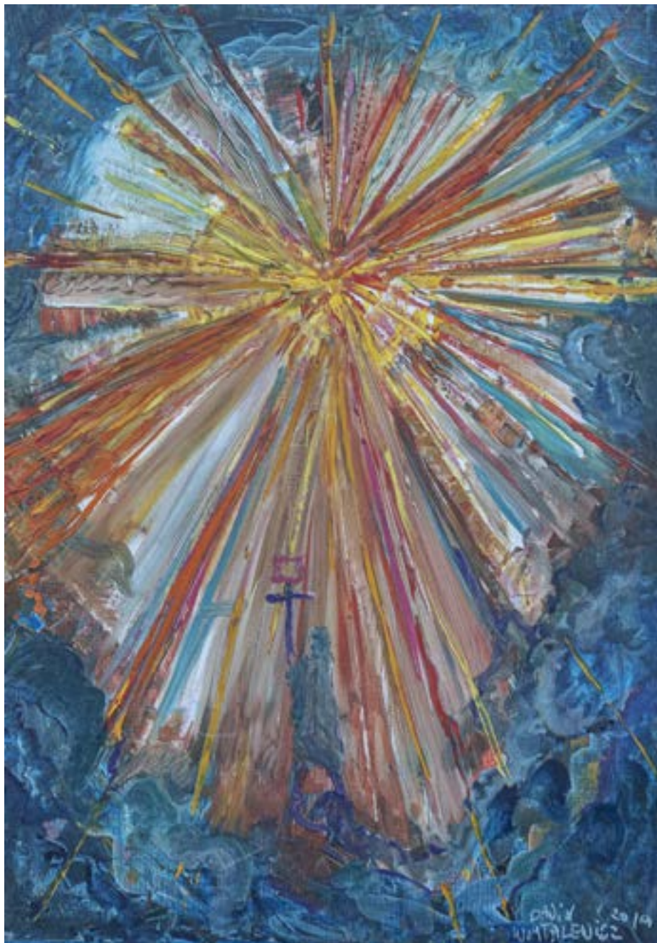
70×50 cm, olej na płótnie