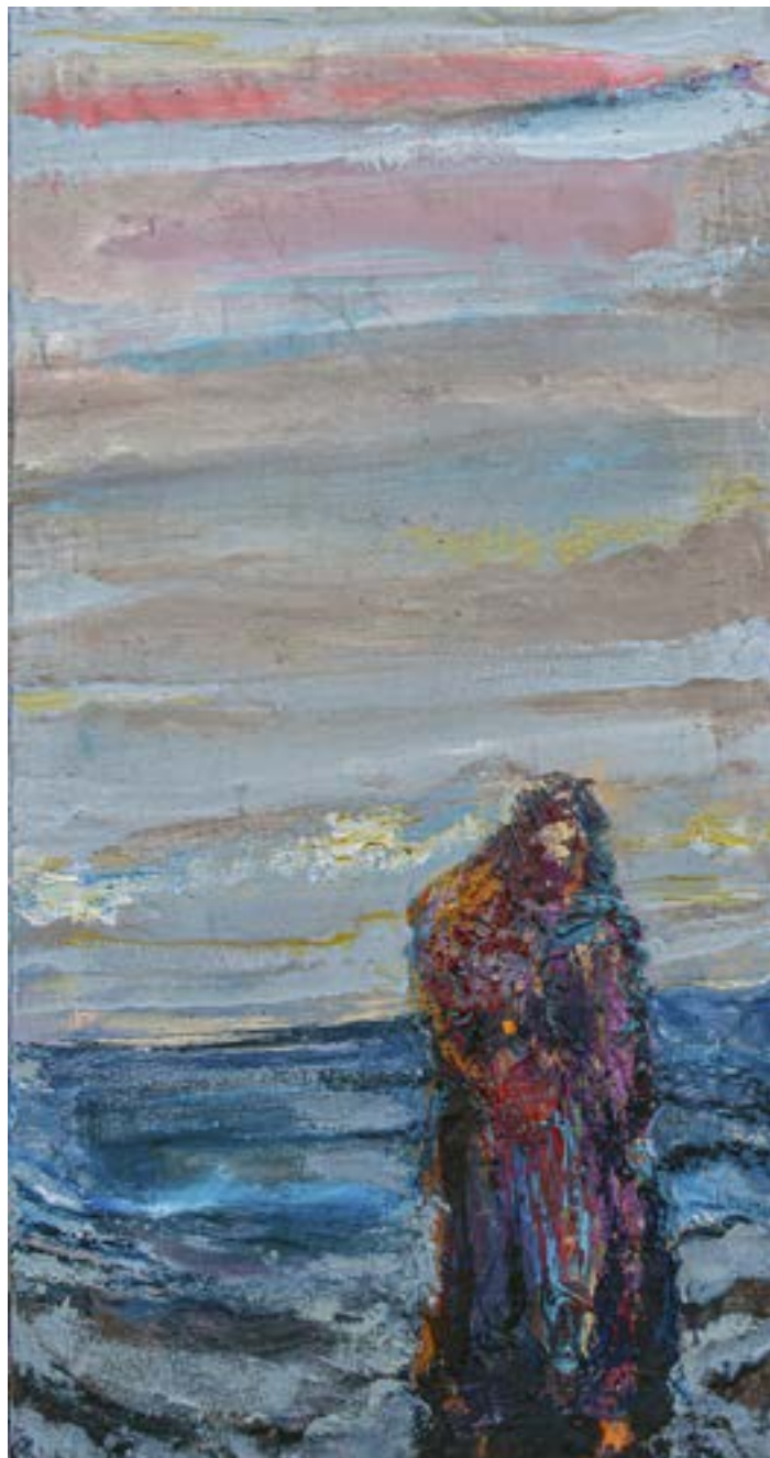
100 × 55 cm, olej na płótnie