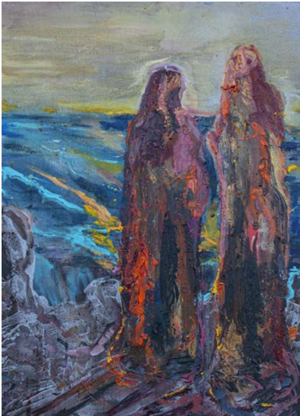
70×50 cm, olej na płótnie