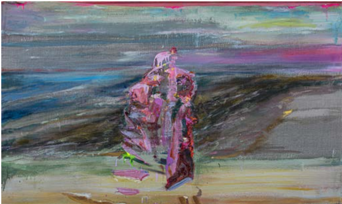
90 × 150 cm, olej na płótnie