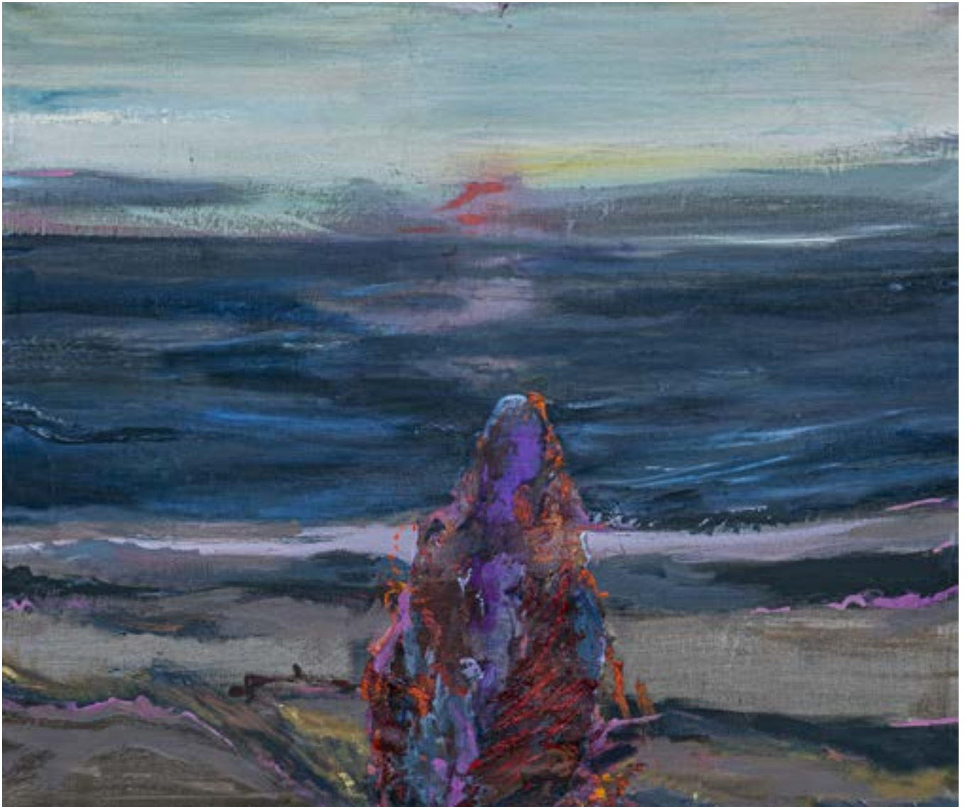
120 × 150 cm, olej na płótnie