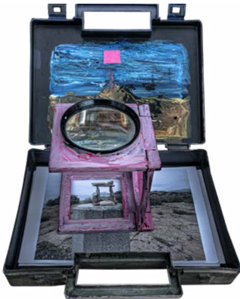
Obiekt – walizka