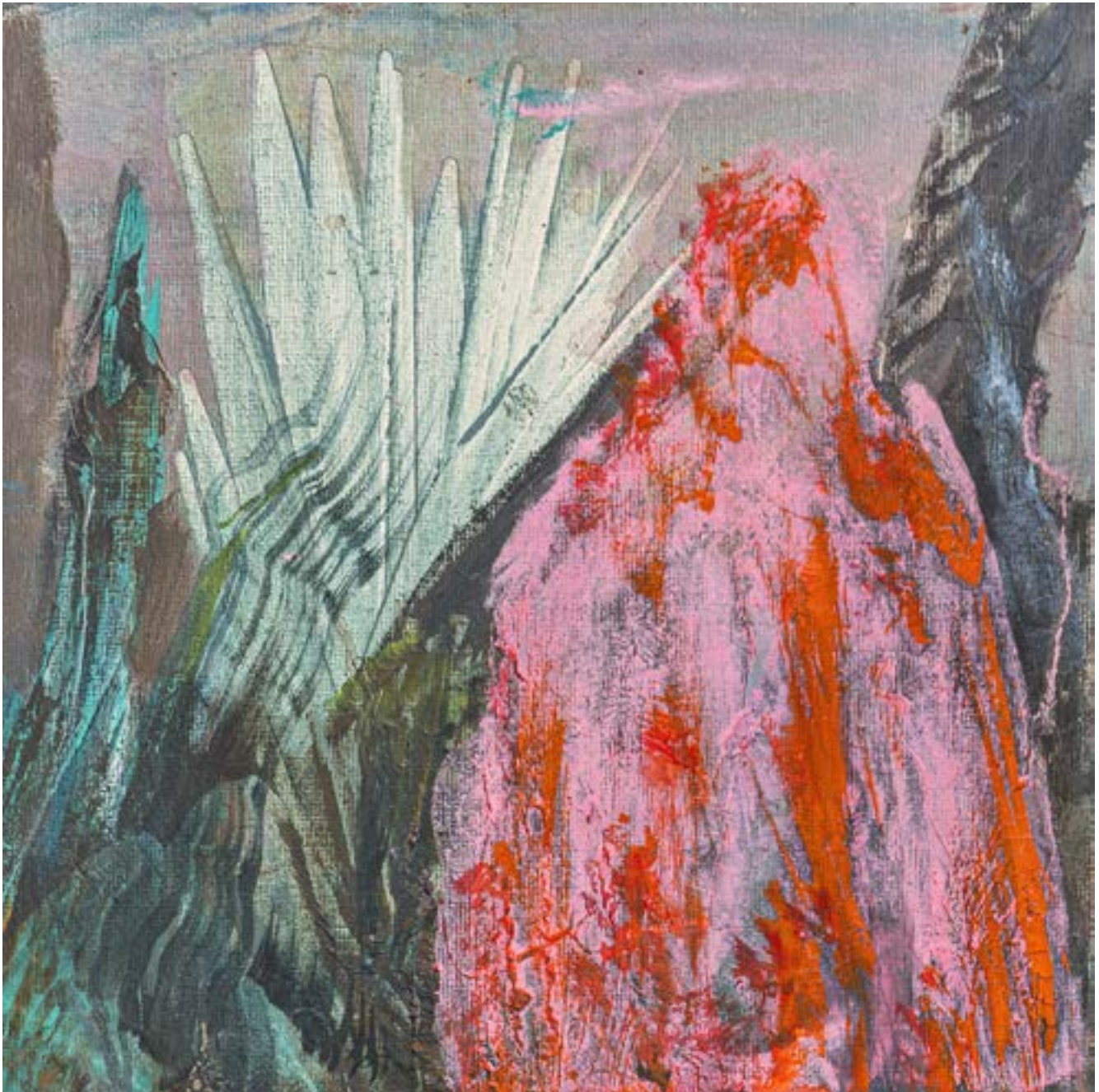
30 × 30 cm, technika własna na płótnie