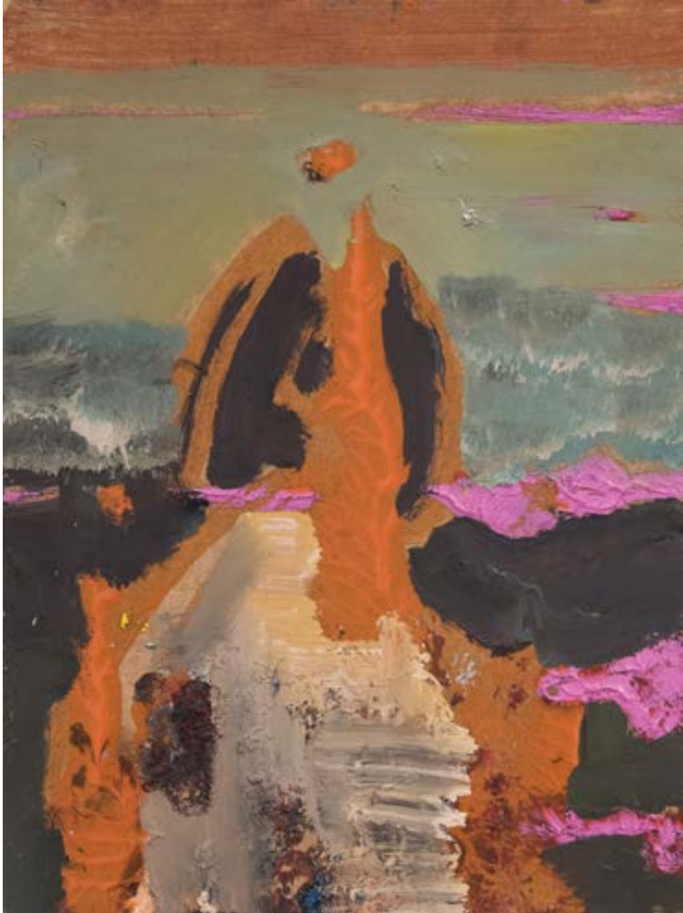
30 × 22 cm, olej na desce