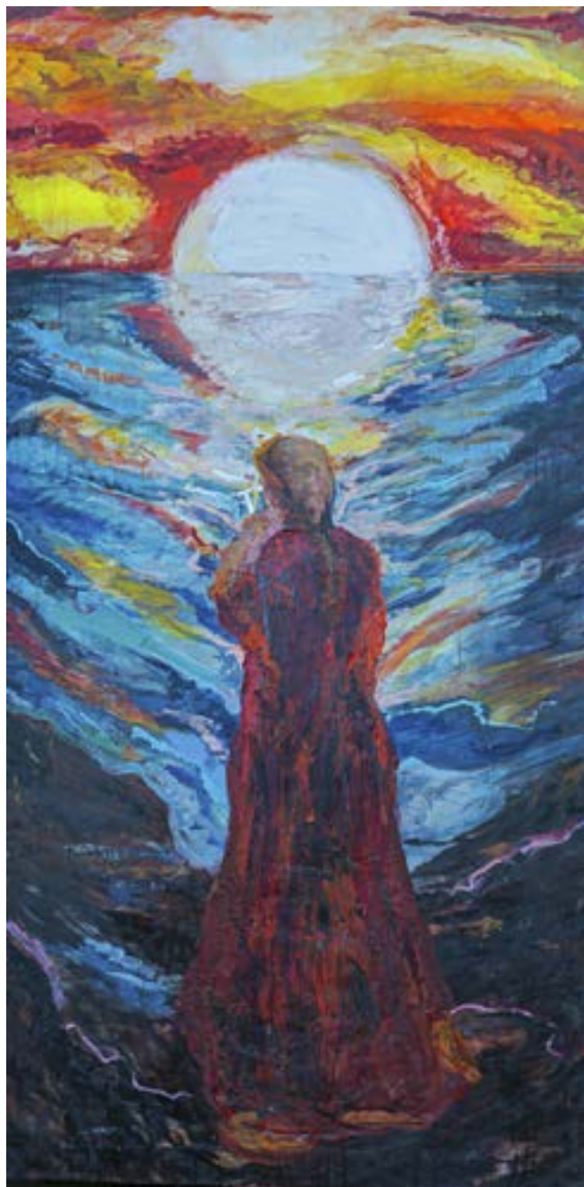
200 × 100 cm, olej na płótnie, w kolekcji Jana Nowaka