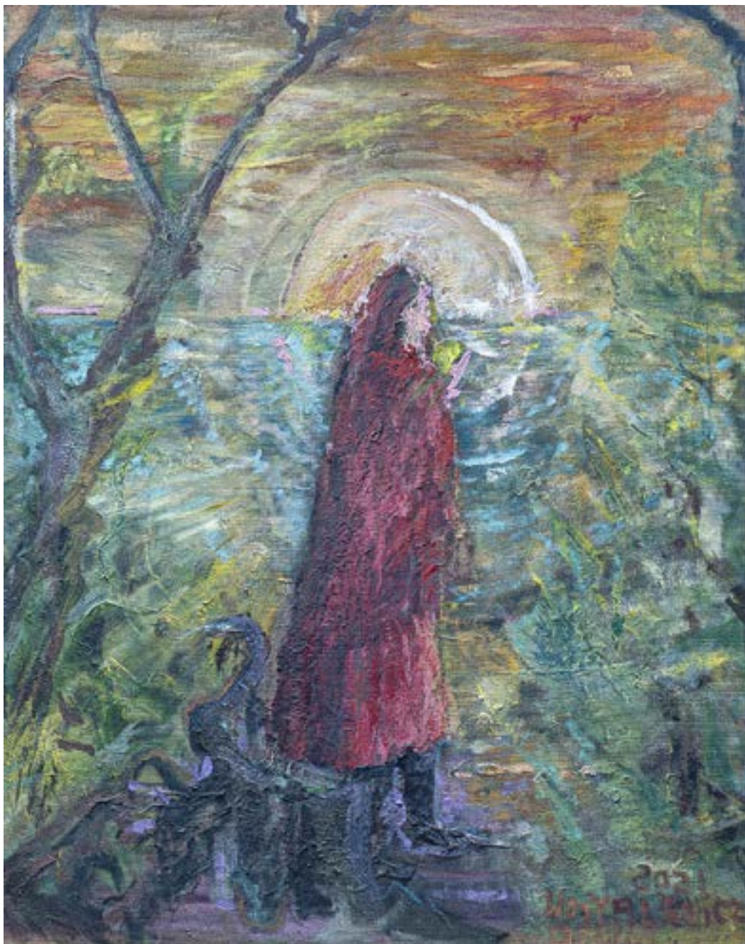
100 × 90, olej na płótnie