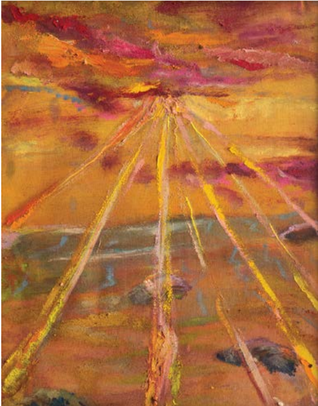
44 × 32 cm, olej na płótnie