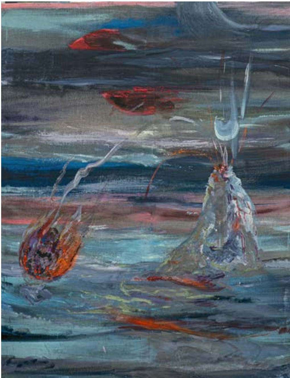
150 × 120 cm, olej na płótnie