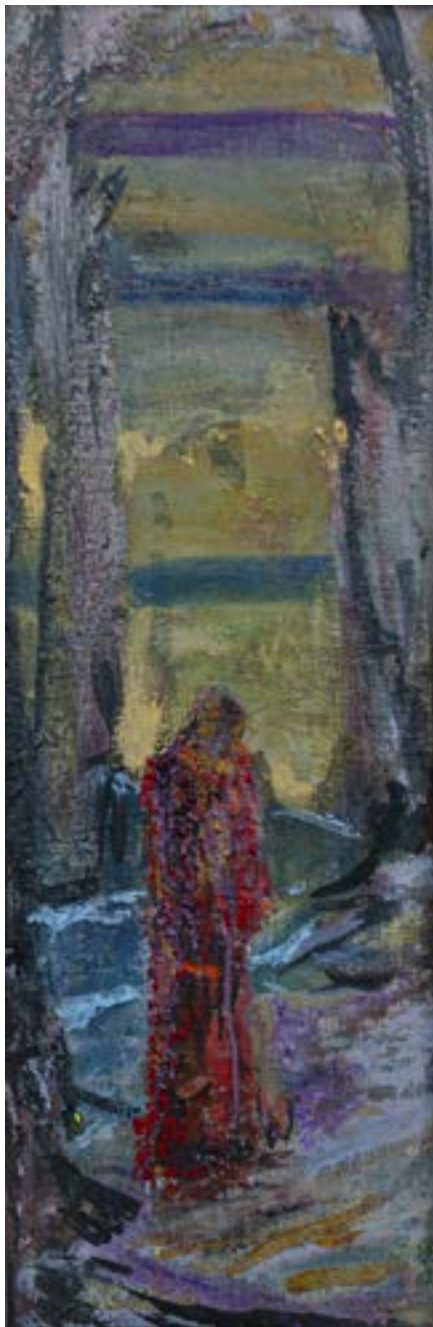
90 × 30 cm, olej na płótnie