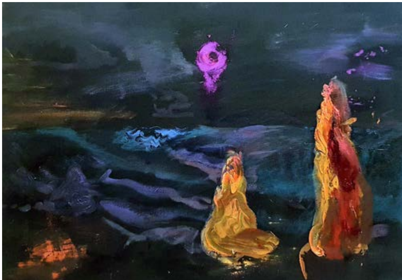
50 × 70 cm, olej na płótnie