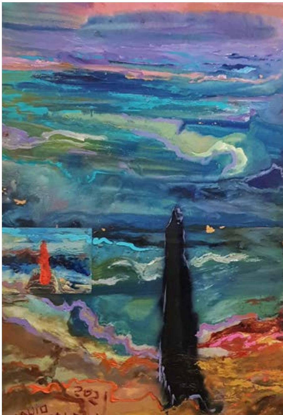
80 × 50 cm, olej na desce