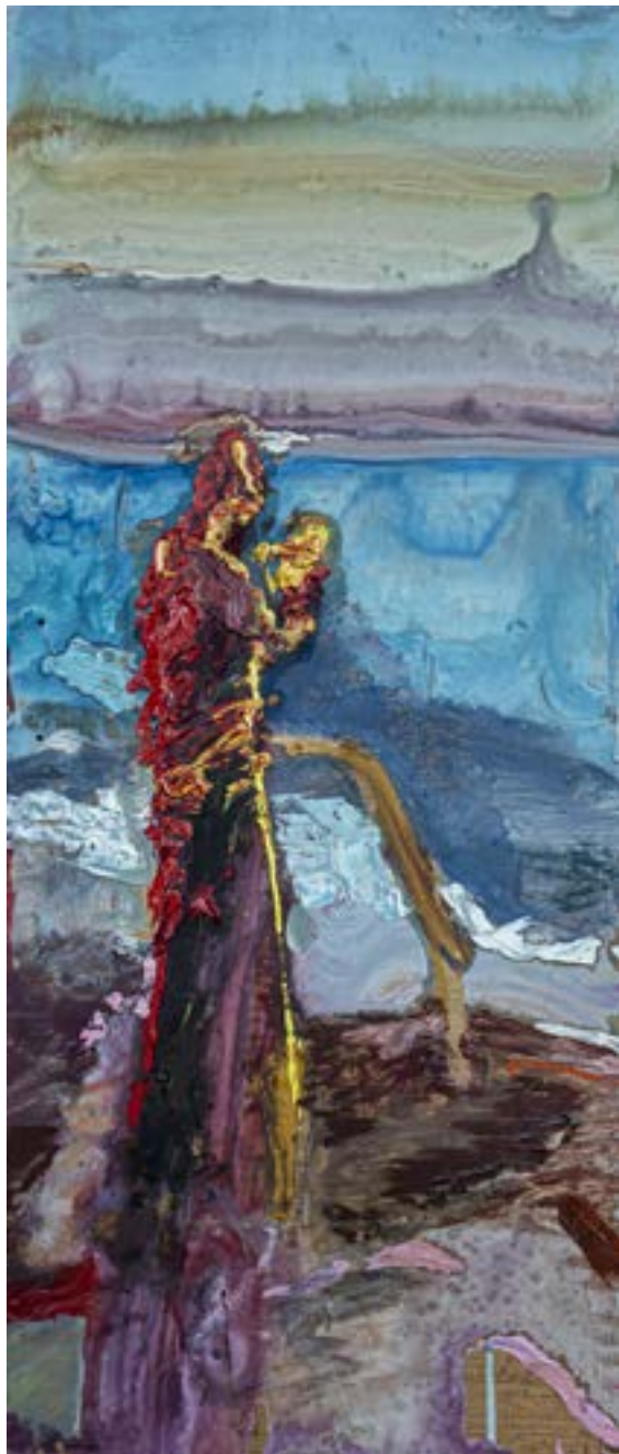
85 × 35 cm, olej na desce