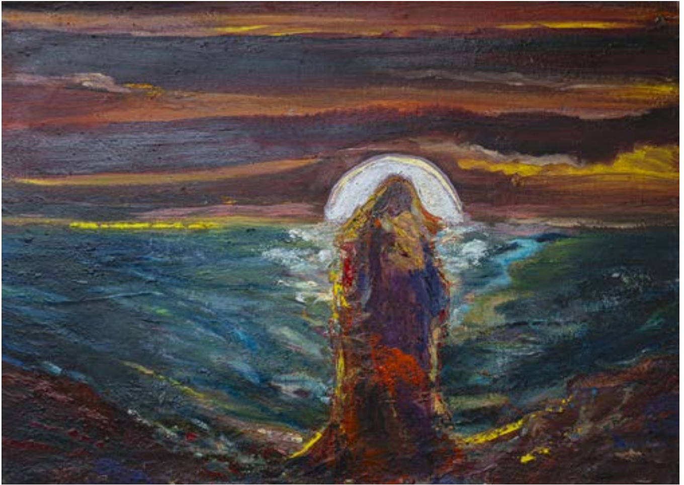
50 × 70 cm, olej na płótnie