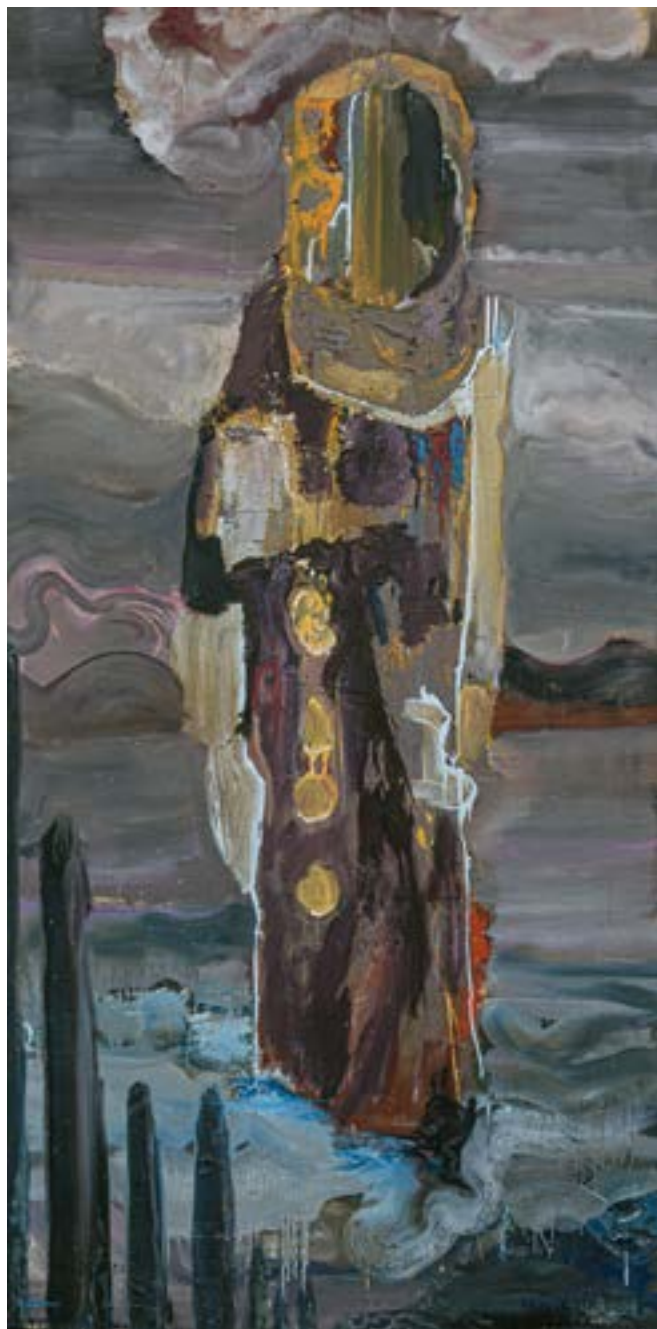
200 × 100 cm, olej na płótnie