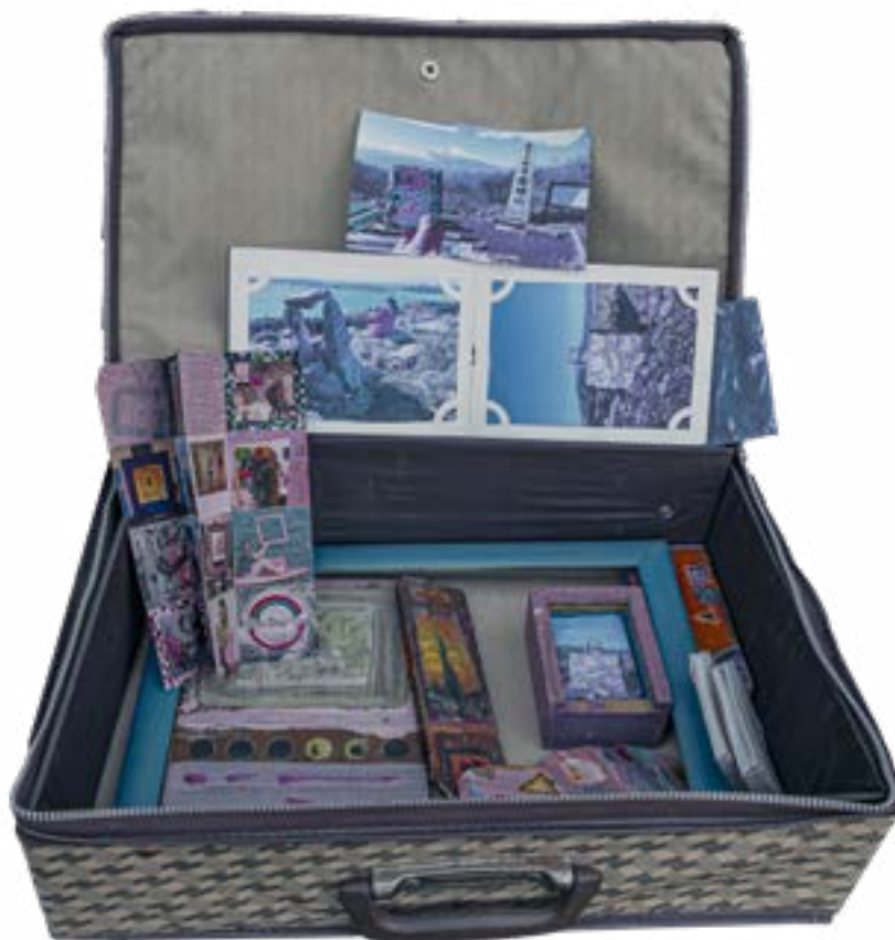
Obiekt – walizka