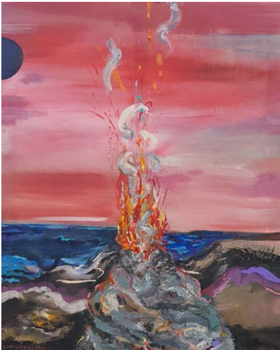
150 × 120 cm, olej na płótnie