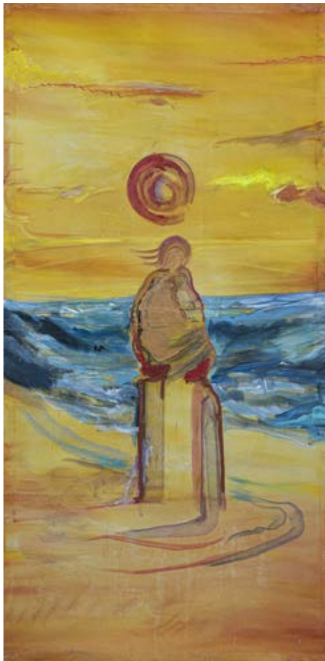
200 × 100 cm, olej na płótnie