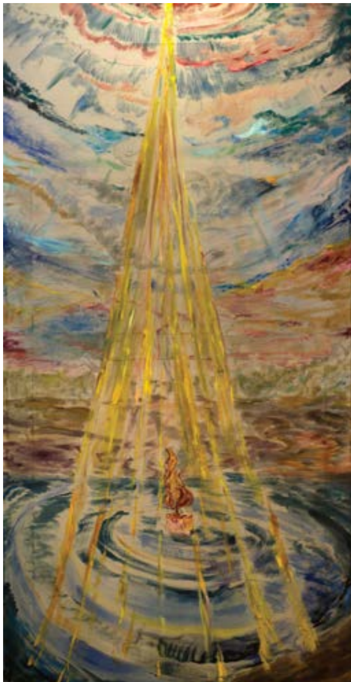
240 × 120 cm, olej na płótnie