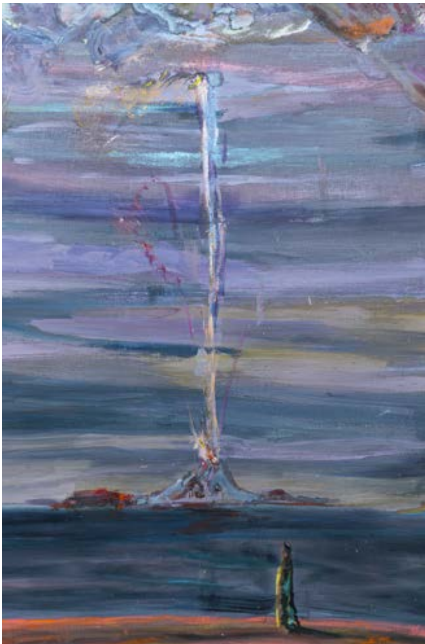
150 × 120 cm, technika własna na płótnie