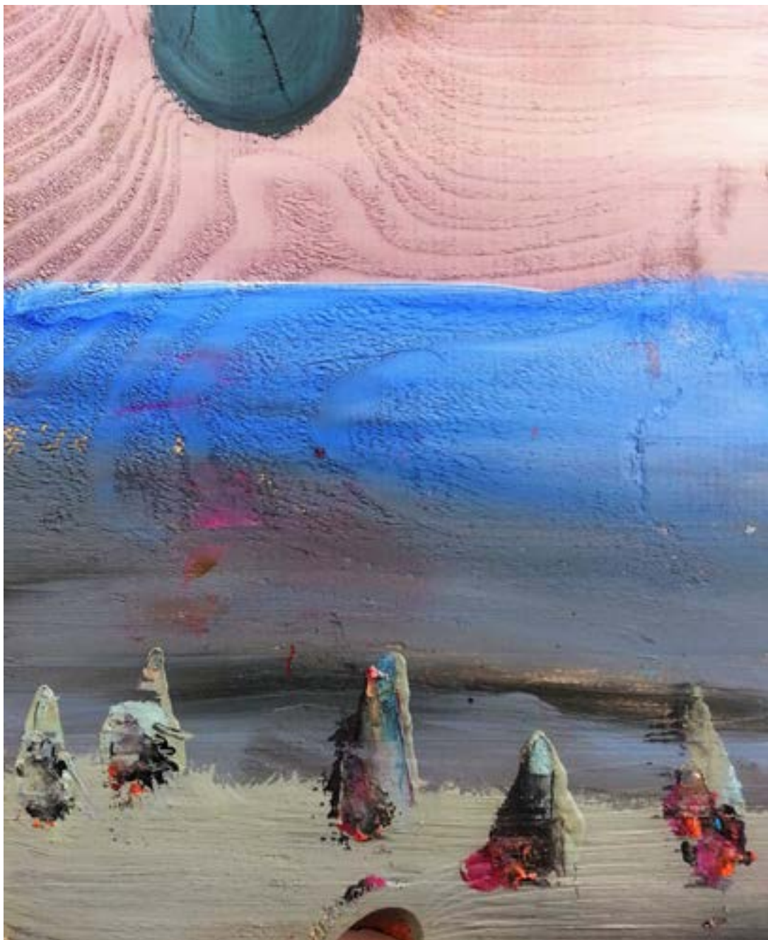
38 × 28 cm, technika własna na desce