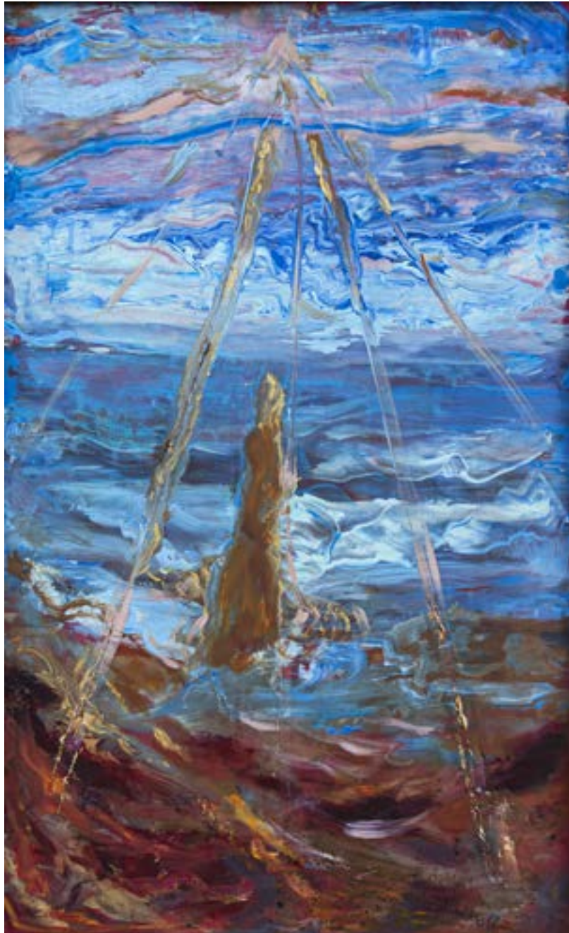
60 × 40 cm, olej na płótnie