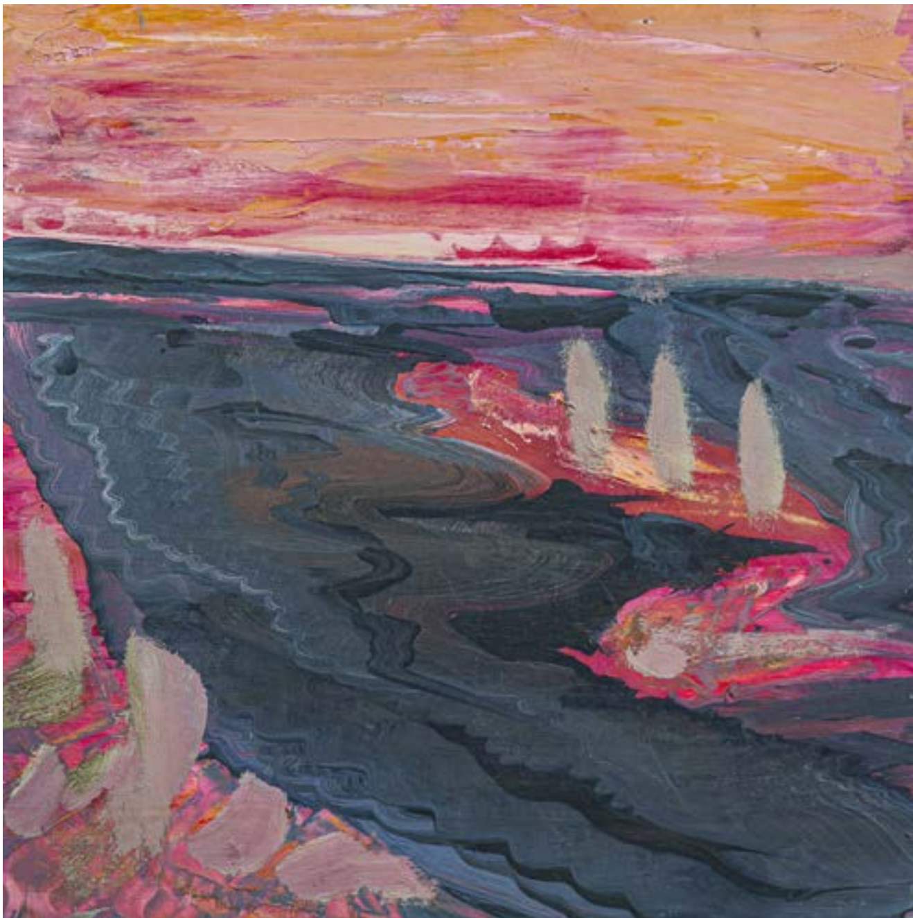
44 × 35 cm, olej na desce, w kolekcji Aleksandry Majzel Wojtalewicz