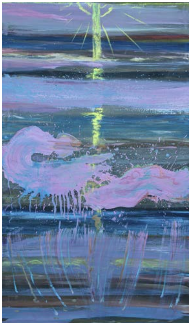
150 × 90 cm, olej na płótnie