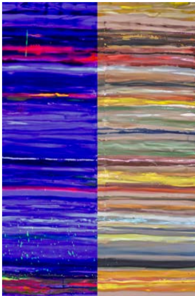
150 × 100 cm, technika własna na płótnie, na zdjęciu prawa strona w świetle naturalnym, lewa w świetle kolorowym

Prace oparte na podręczniku do fizyki o interferencji światła w warstwach cienkich, znalezionym na przystanku autobusowym po drodze z zakupów do pracowni, są inspirowane nauką Johanneses Ittena, wybitnego nauczyciela sztuki koloru, znanego ze swojego wkładu w dziedzinę teorii koloru oraz mistycyzmu artystycznego. Opowiadają one o kolorze pigmentu zatopionego w różnych mediach, gęstościach i falach świetlnych, które zmieniają się w ciągu dnia. Dodatkowo, pokazują oddziaływanie koloru na siebie w falach odbitych. W trakcie prezentacji światła widz doświadcza w przyspieszonym tempie zjawiska znanego jako time-lapse dnia, ukazującego dynamiczne zmiany oświetlenia w ciągu dnia.