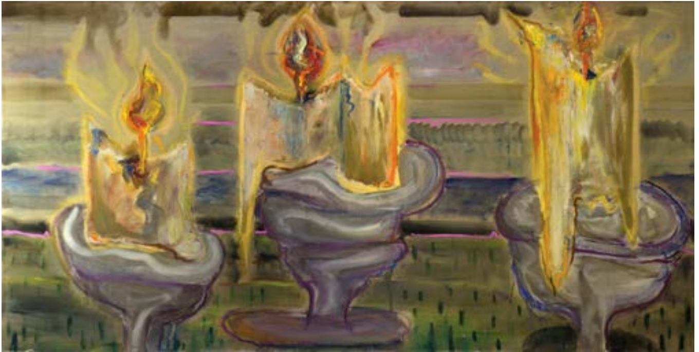
120 × 240 cm, olej na płótnie