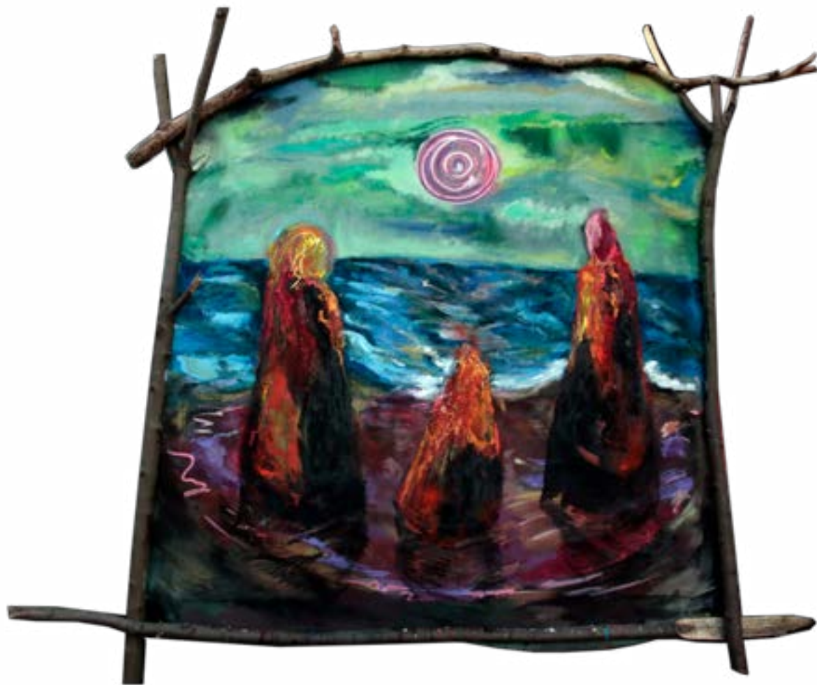
150 × 150 cm, olej na płótnie, z ramą