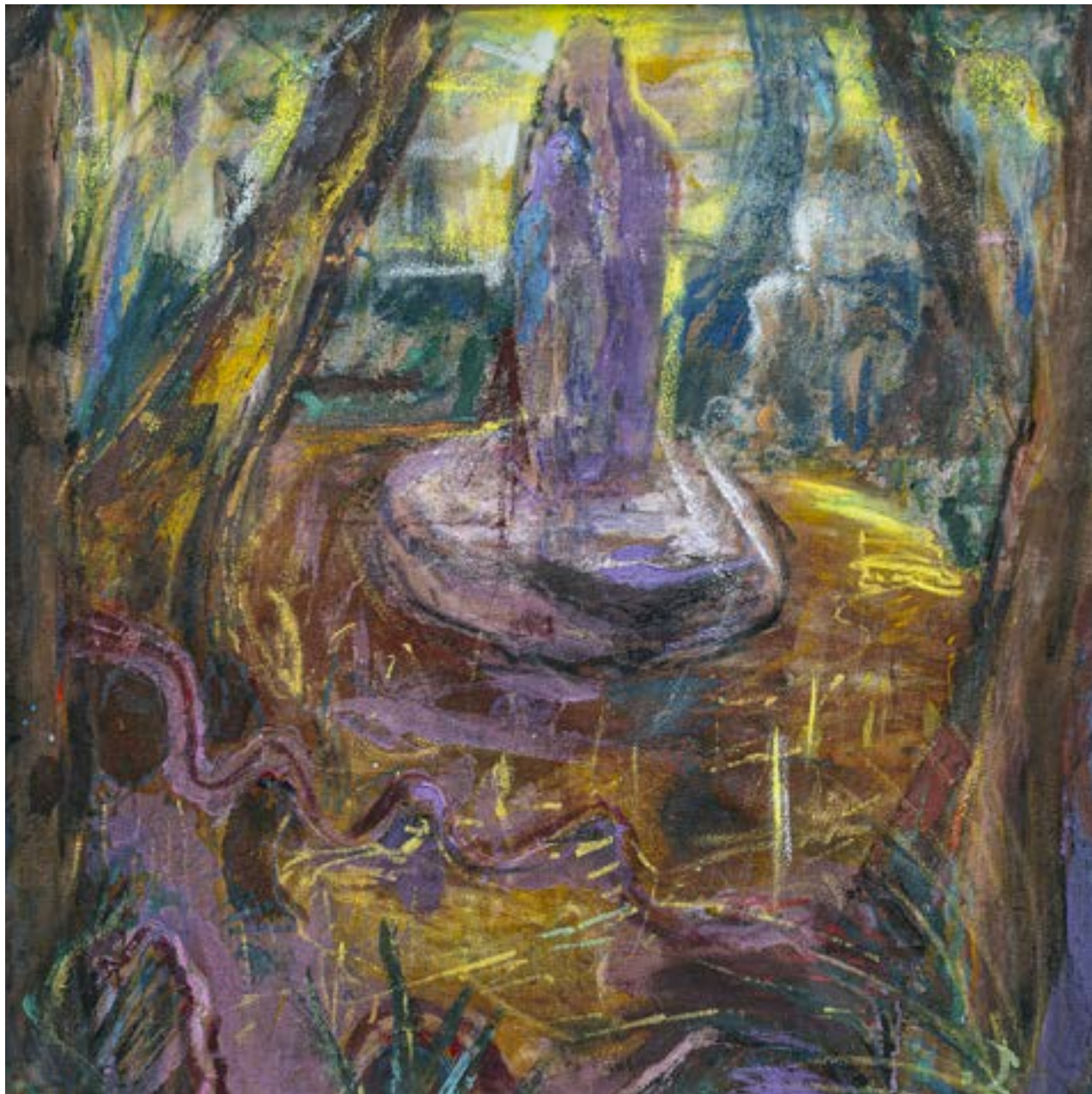
80 × 80 cm, technika własna na płótnie