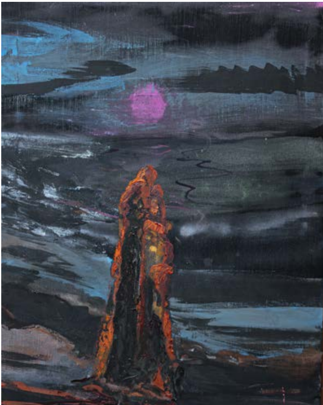
90×60 cm, olej na płótnie