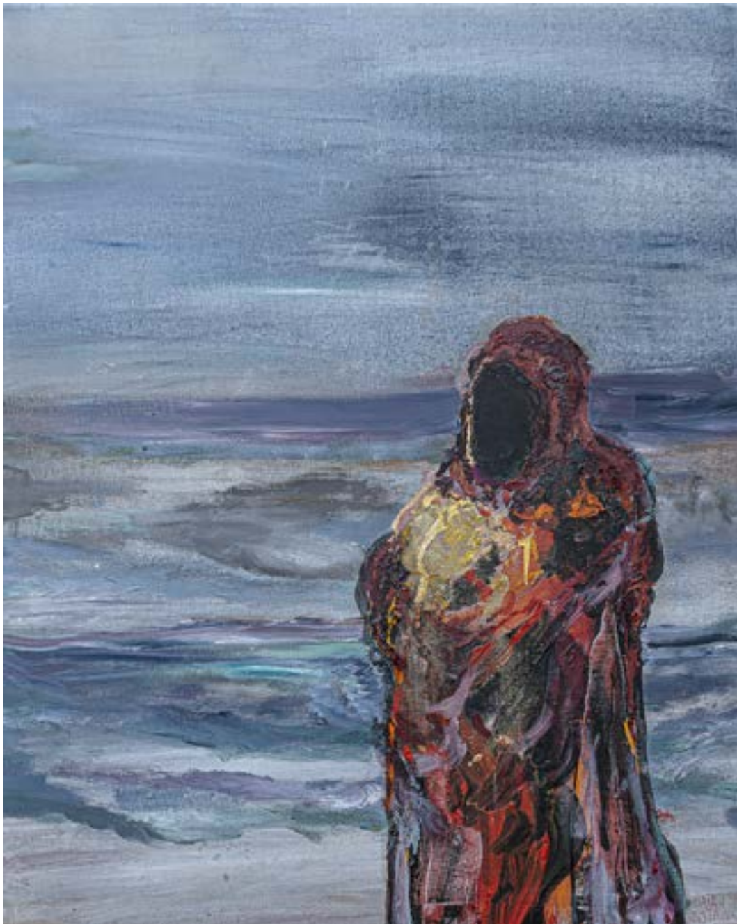
100 × 80 cm, olej na płótnie