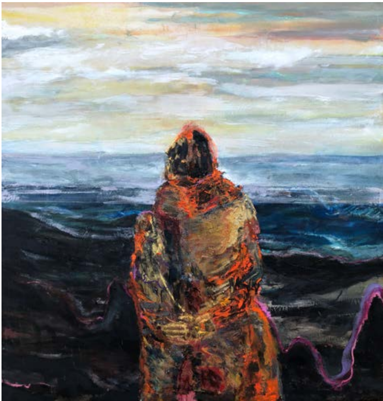
190 × 170 cm, olej na płótnie