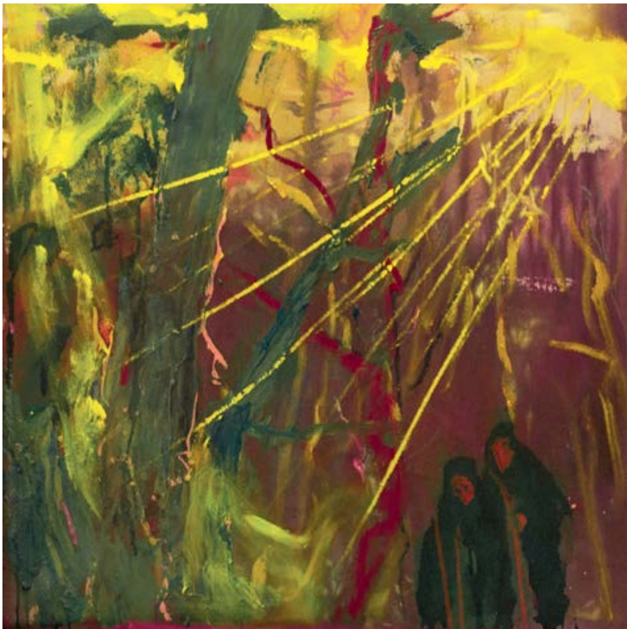
75 × 75 cm, olej na płótnie